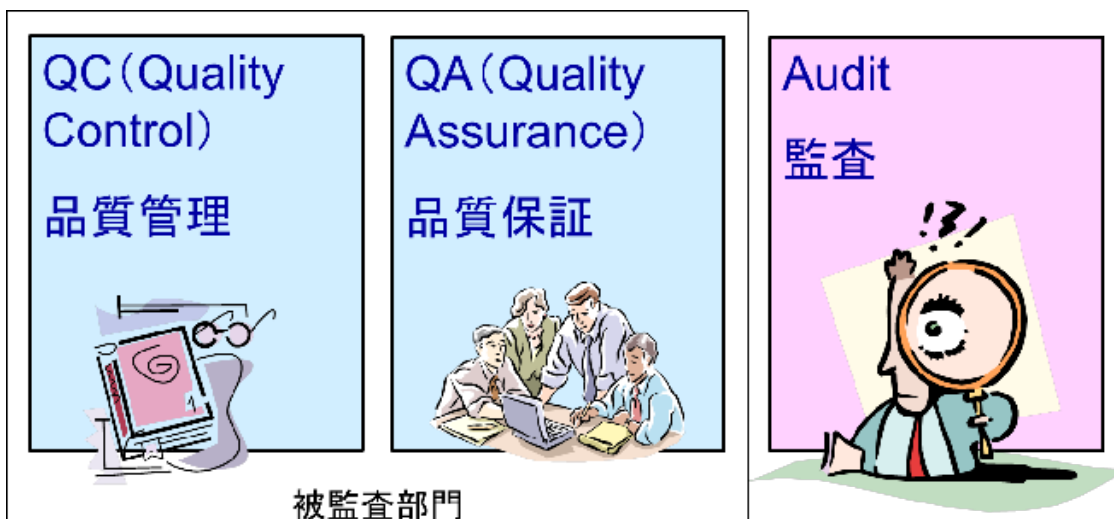
図 1. QC、QA、監査の違いとは

一般に後段のプロセスで、データのチェックを行うと、データの品質はなかなか向上しないというジレンマに陥る。本来、データの入力チェックはデータソース側（入力側）で実施し